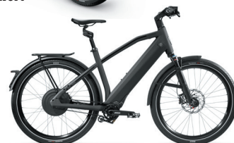
Sport, Suspension Fork & Suspension Seatpost Kinect