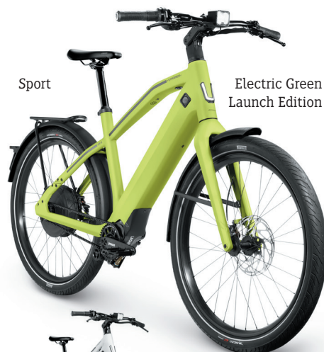
Sport Electric Green Launch Edition