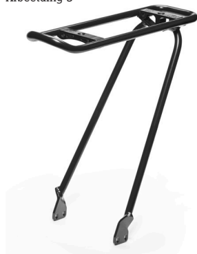
Optie af fabriek met verende voorvork, Kinect en bagagedrager