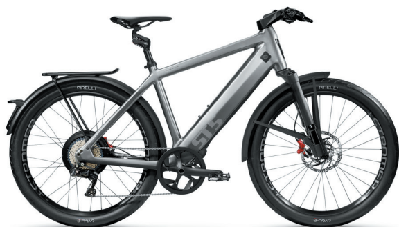
ST5 | Suspension Fork 27.5" Deep Black & Suspension Seatpost Kinect