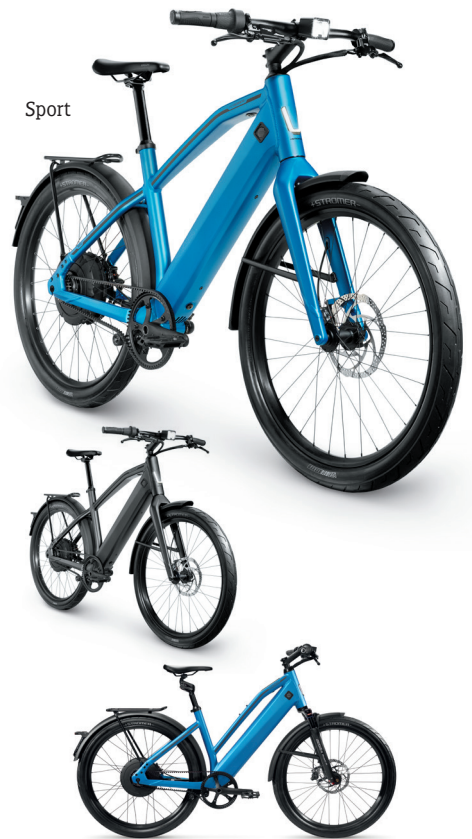
Comfort, Suspension Fork 27.5" Raidon Black & Suspension Seatpost Kinect